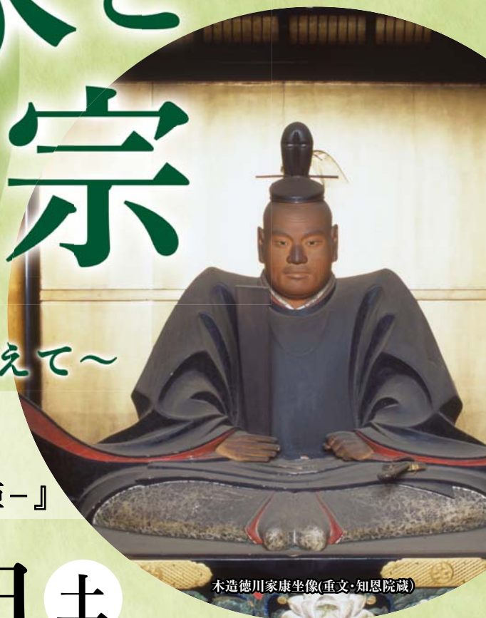
木造徳川家康坐像(重文・知恩院蔵)